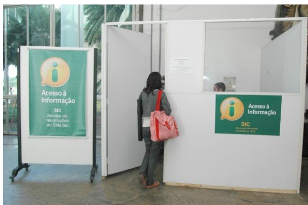
Espaço SIC-UFRJ, no saguão de entrada do prédio da reitoria

O SIC-UFRJ recebeu 110 solicitações, no período de 16/05/2012 a 03/10/2012. Destas solicitações, 19 foram negadas pelos motivos abaixo: