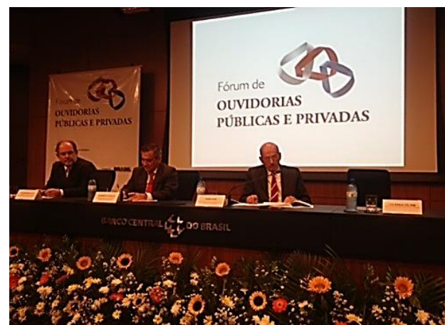
Ministro Jorge Hage e Ministro Gilberto de Carvalho na abertura do Fórum.