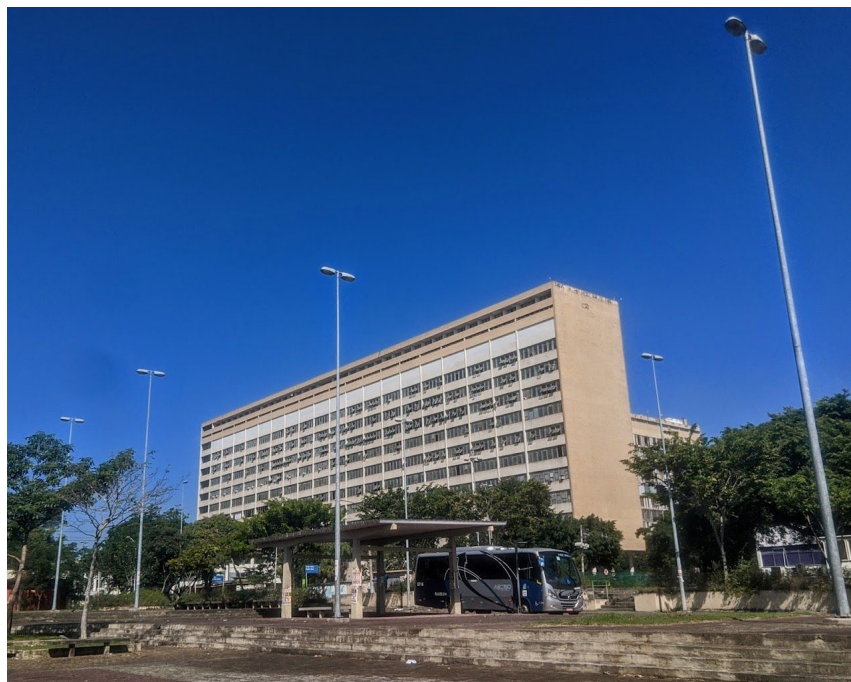
Enfermeira- Hospital Universitário Clementino Fraga Filho- UFRJ 1989-1999